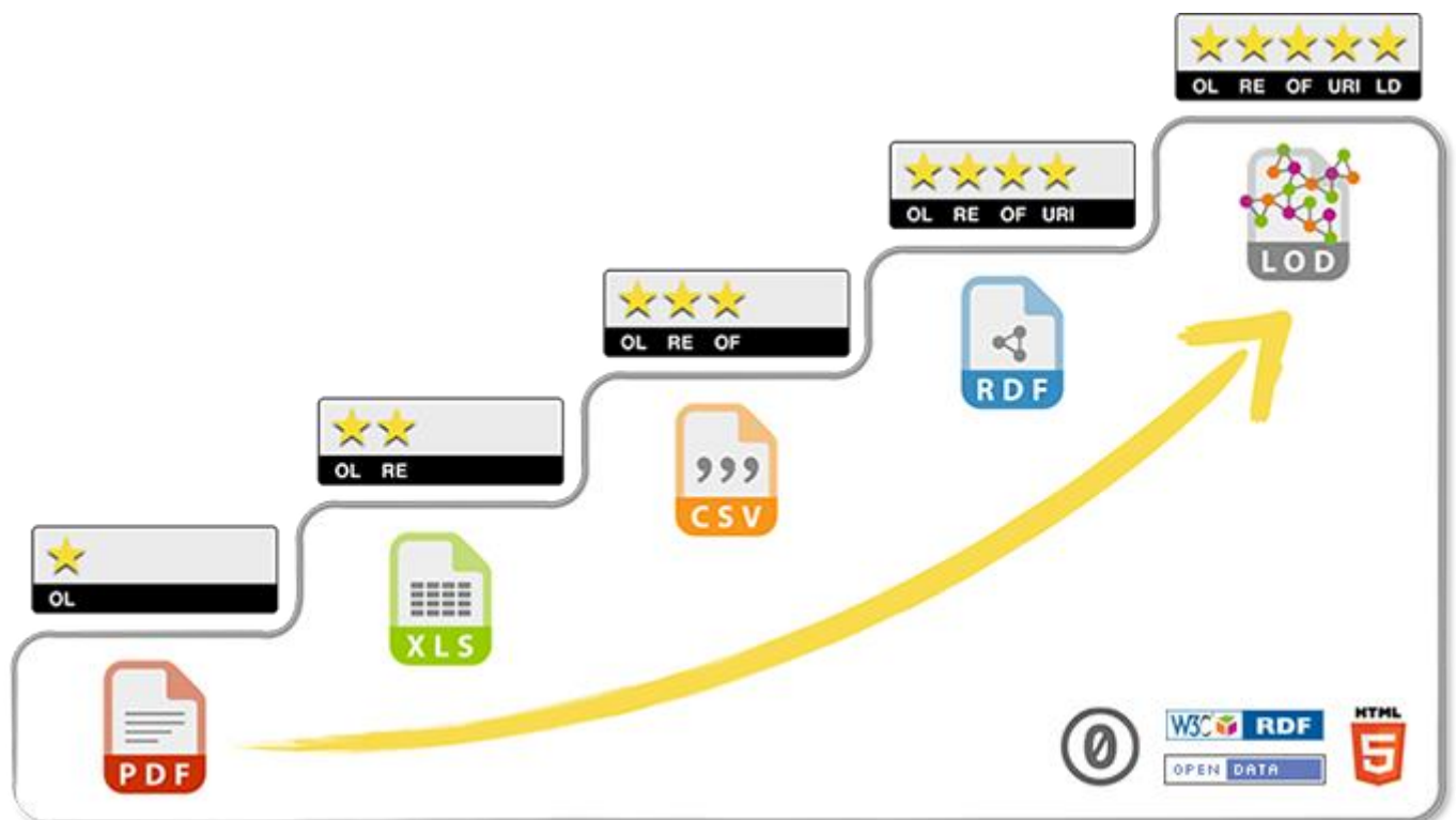
Obrázek 1 Pět stupňů otevřenosti